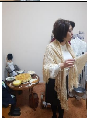
Беседы «Культура и быт осетинского народа