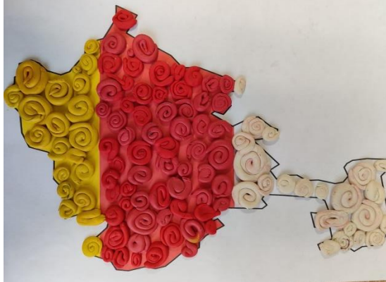
Аппликация «Флаг Осетии»