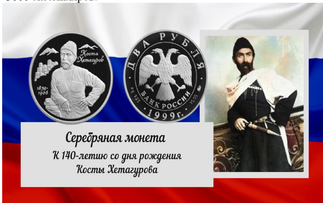
Серебряная монета К 140-летию со дня рождения Косты Хетагурова

В 1999 году Банк России выпустил в обращение серебряную памятную монету номиналом 2 рубля. Монета посвящена 140-летию со дня рождения Косты Хетагурова, входит в серию "Выдающиеся личности России". Тираж данной монеты - 3000 экземпляров.