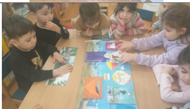
Беседы по тематическим альбомам