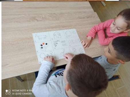
Рассказывание осетинских сказок с использованием мнемотаблиц