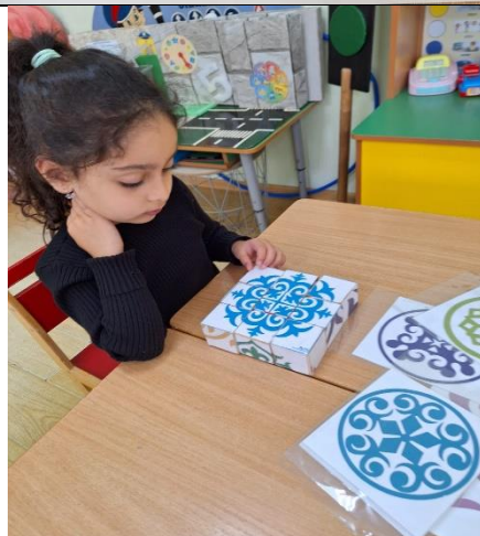
Настольные игры «Пазлы» «Разрезные картинки»